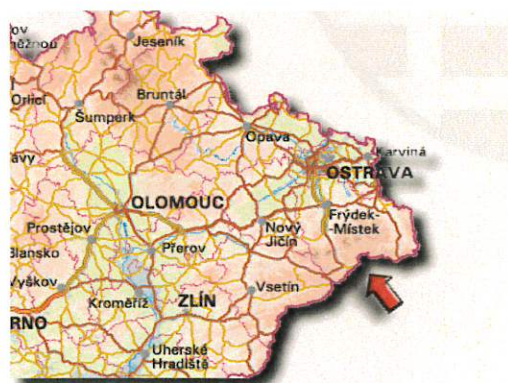
Obrázek: Region Severní Morava